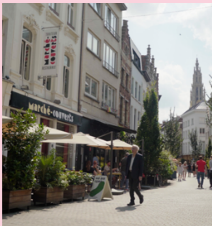
De Lange Koepoortstraat : van te mijden straatje tot een verborgen culinair 'dorpje in de stad'.