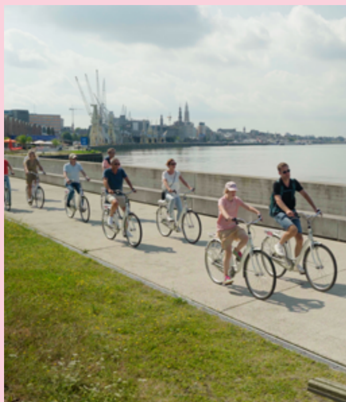
Langs de vernieuwde Scheldekaaien kan je relaxed wandelen en fietsen aan het water.