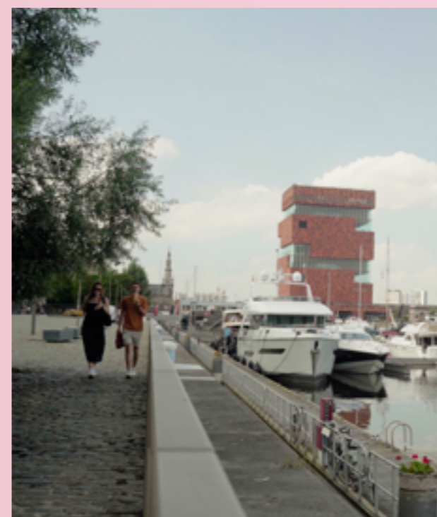
Het Eilandje staat al lang bekend als een van de hipste wijken van Antwerpen met lekker eten, relaxed leven rondom het water en het meest iconische museum van de stad.