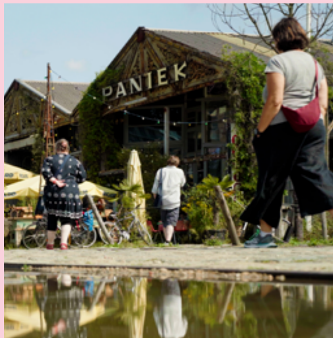
De Sint-Paulusplaats is een gezellig plein op amper 7 min wandelen met heel wat hippe cafeetjes en terrasjes.